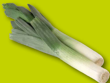
PORREE Bio-Landwirtschaft Achleitner