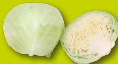
FRÜHKRAUT Bio-Landwirtschaft Achleitner