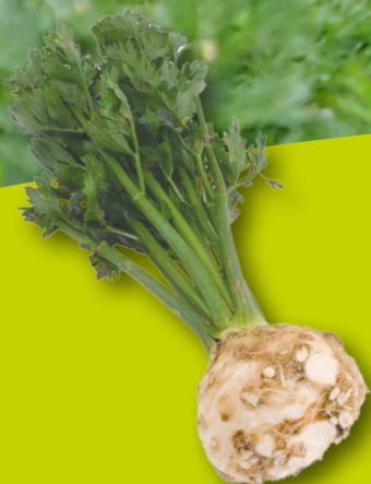
SELLERIE MIT GRÜN Bio-Landwirtschaft Achleitner